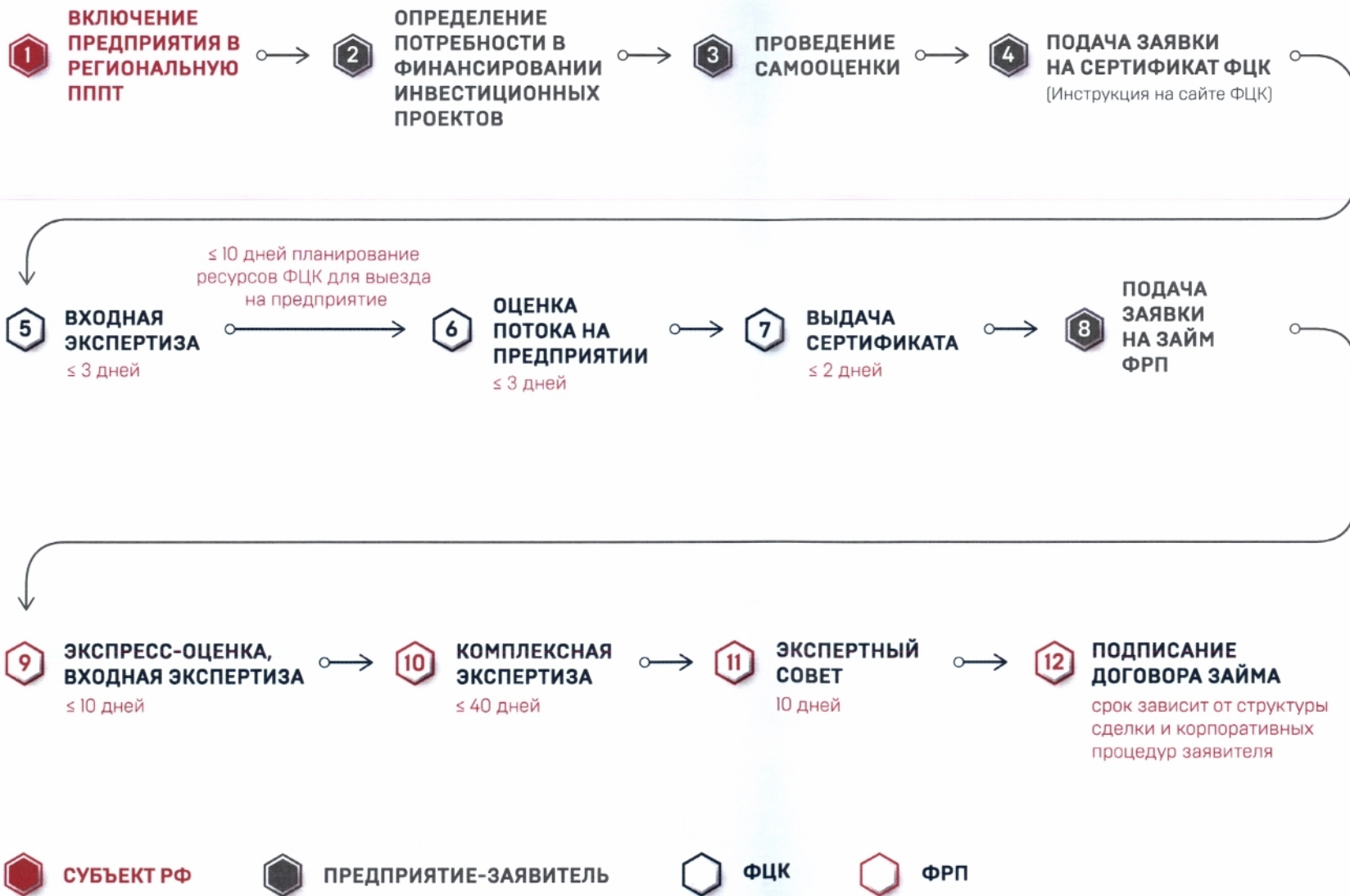
СХЕМА ПОЛУЧЕНИЯ ЗАЙМА НА ПРОЕКТ ПО ПОВЫШЕНИЮ ПРОИЗВОДИТЕЛЬНОСТИ ТРУДА